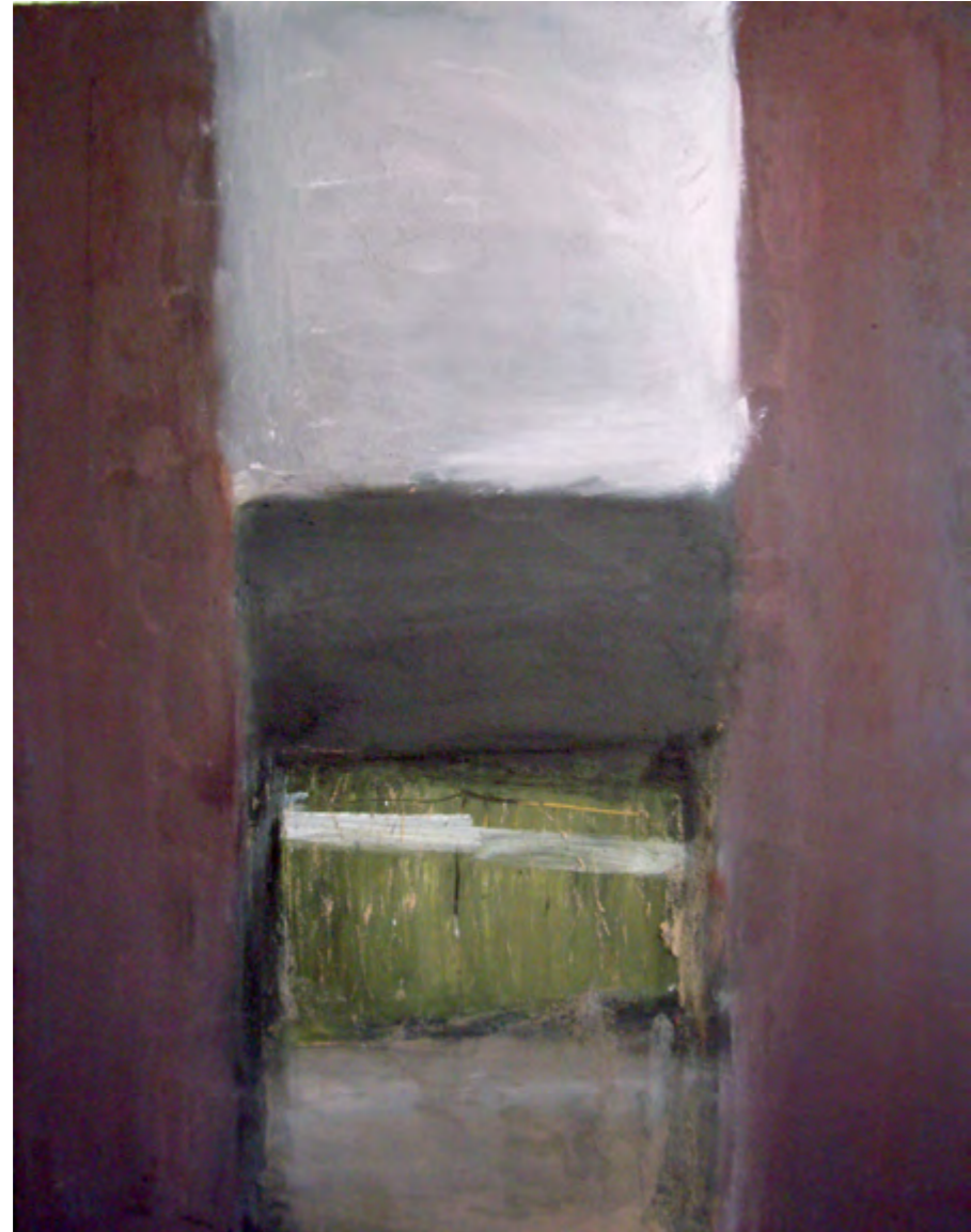
Elements 01/ tm sobre madera/ 100x130/ 2008