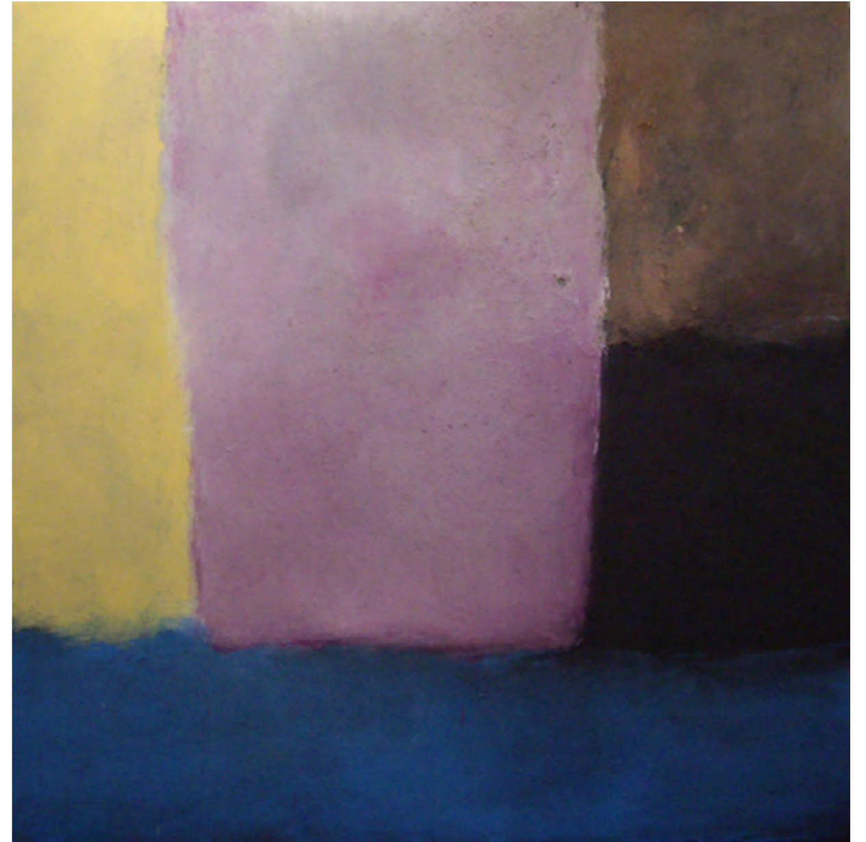
Quinto Elemento/ tm sobre madera/ 200x200/ 2007