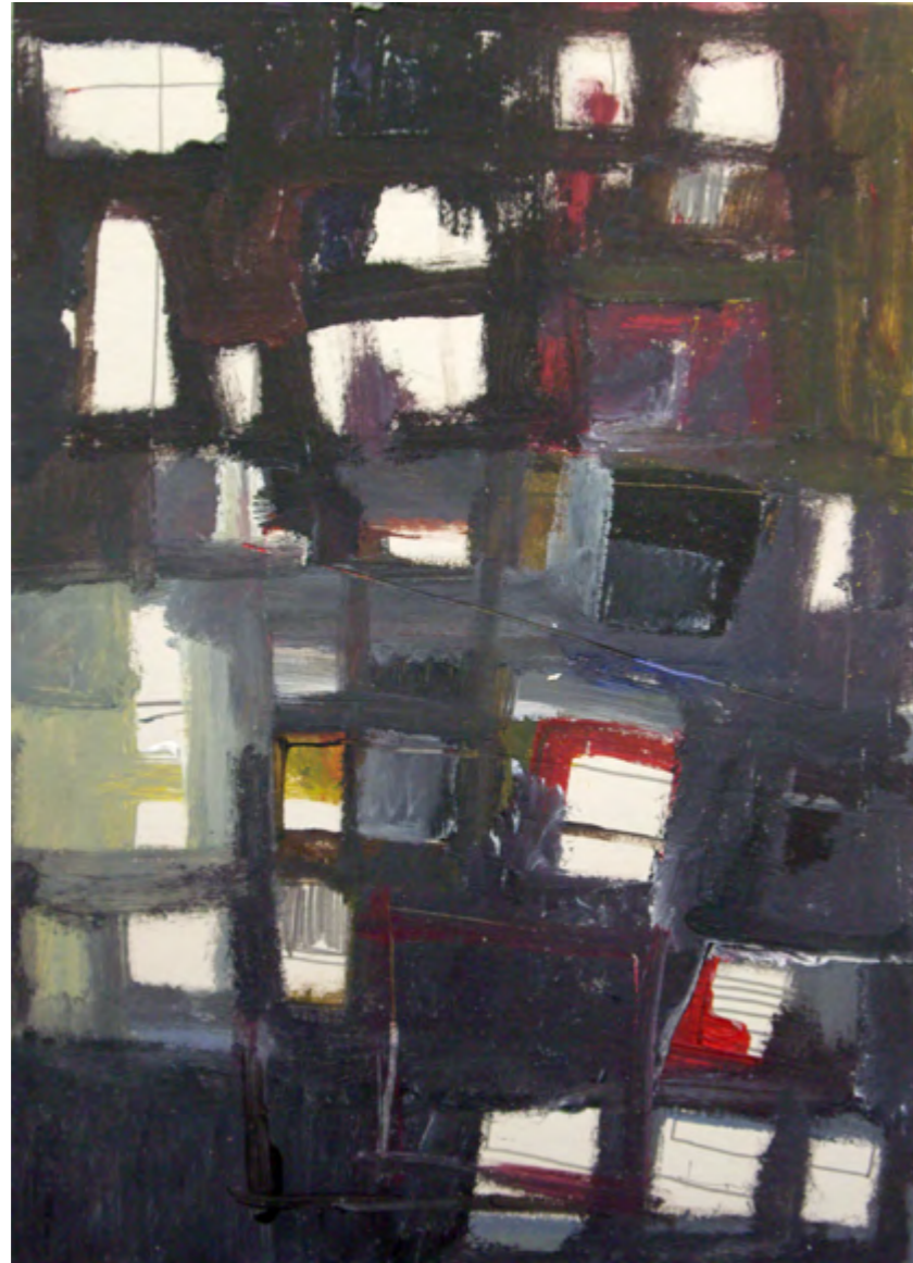
Arquitectura&Textura I / tm sobre cartón/ 50x70/ 2006