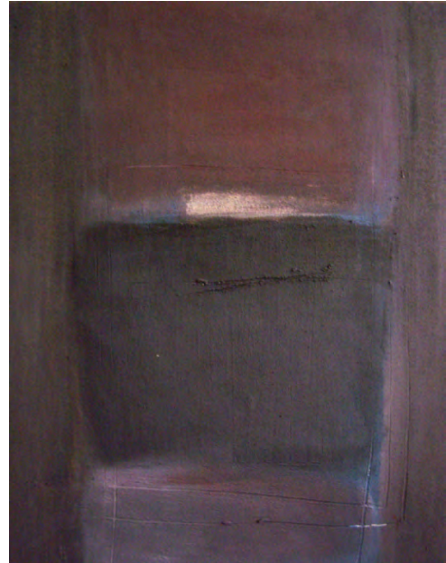
Elements 02/ tm sobre madera/ 100x130/ 2008