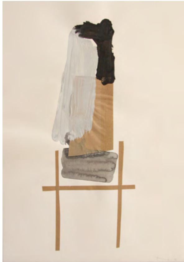
Arquitectura i Paisatge/ tm sobre papel/ 42x60/ 2008 Forma 4/ tm sobre papel/ 42x60/ 2008