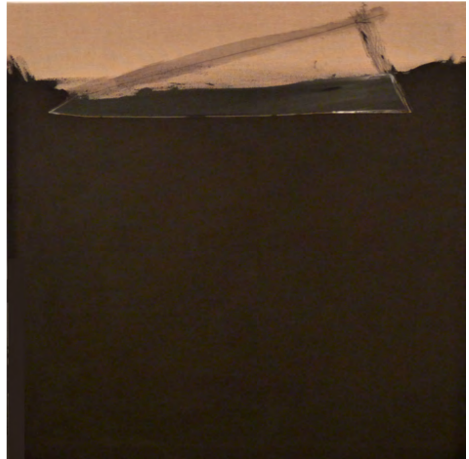
Triangle/ tm sobre lienzo/ 70x70/ 2008