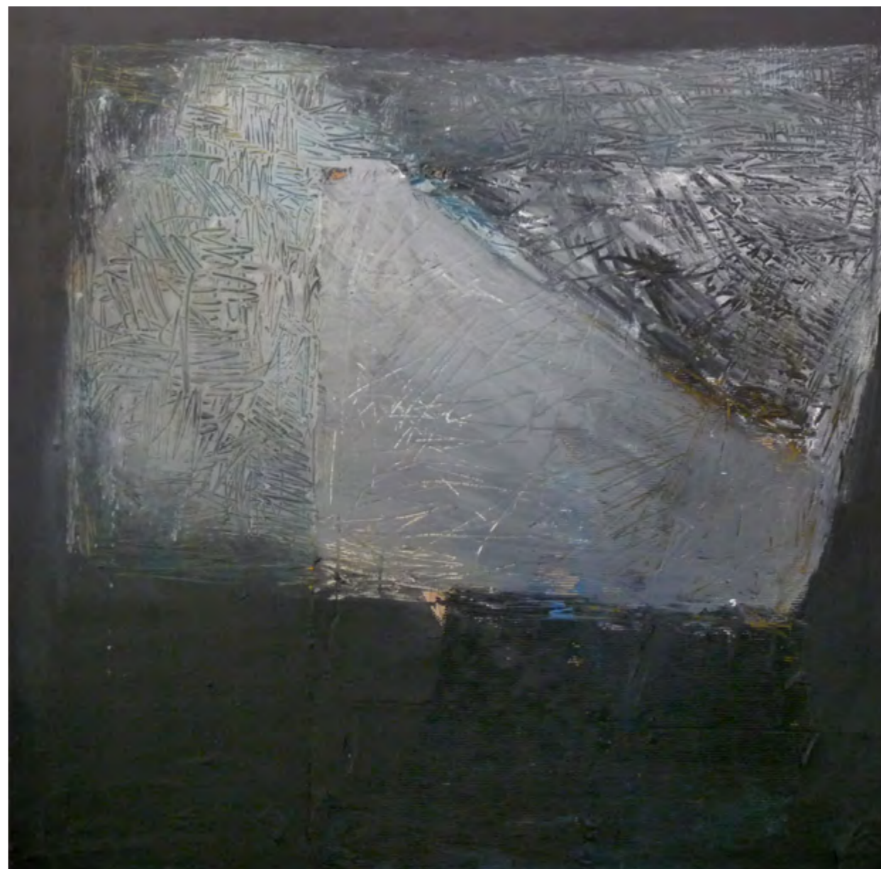
Forma i Territori/ tm sobre mader /120x120/2009