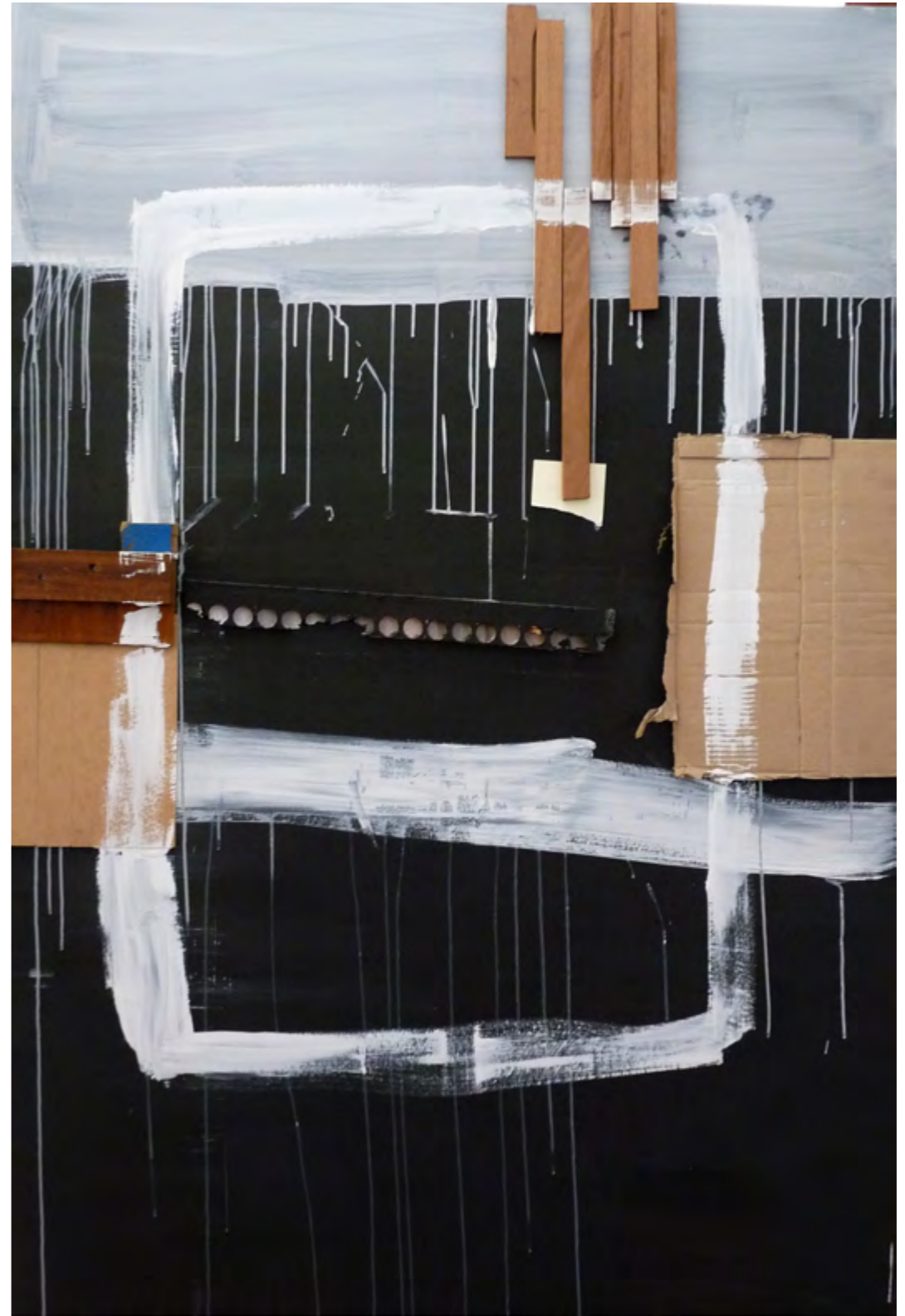
Proces Primitiu/ tm sobre tela/ 130x195/ 2004-05